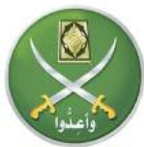
« Frères Musulmans »

Veillez trouver ci-dessus des exemples pour des organisations et des groupes islamistes évoluant en Allemagne, généralement sans avoir recours à la violence: