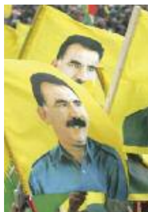
fête du nouvel an « Newroz »

Ce sont aussi des offres d'aide que les extrémistes kurdes font aux réfugiés venus en Allemagne. Ils indiquent p. ex. des associations kurdes au sein desquelles il est facile de nouer des contacts sociaux. L'aide offerte peut prendre diverses formes telles que la distribution de repas et de dons de vêtements ou le soutien dans le cadre de démarches administratives.