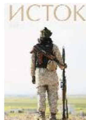
Propagande djihadistes de « l'Etat Islamique » (EI/Daesh)