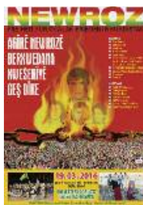
Publicité pour une grande manifestation du PKK à l'occasion de la fête du nouvel an