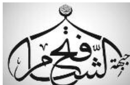
« Jabhat Fath al-Sham » (JFS), ancien « Jabhat al-Nusra » (JaN)