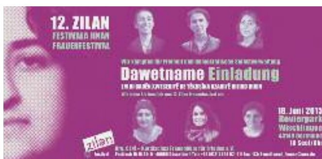
Invitation au festival « Zilan » des femmes

Ces activités du PKK signifient une violation du droit allemand et nuisent aux relations entre la République fédérale d'Allemagne et d'autres États.