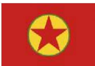
« Partiya Karkerên Kurdistan » (PKK)

L'organisation la plus importante du PKK en Allemagne est le « Navenda Civaka Demokratik ya Kurden li Almanyayê » (« Centre de société démocratique des kurdes en Allemagne », NAV-DEM).