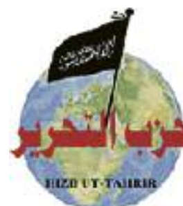
« Hizb ut-Tahrir » (HuT)