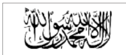
« Taleban »