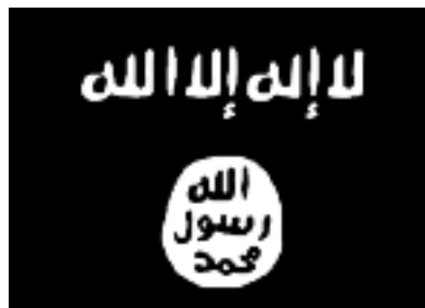
« L'Etat islamique » (EI/Daesh)

Des organisations terroristes ou djihadistes essayent d'établir sur leurs territoires, mais aussi au niveau mondial, un ordre social soi-disant voulu par Dieu en ayant recours à une violence particulièrement brutale. Dans ce contexte, les groupements suivants revêtent une importance particulière: