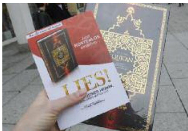
Distribution de Corans par des salafistes