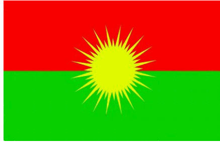
[Emblem des KONGRA GEL]

Begründet wurde dies mit der amerikanischen Intervention im Nord-Irak und der daraus resultierenden Veränderung der politischen Landschaft in der Region. Trotz aller Verlautbarungen, denen zufolge der KONGRA GEL nun endgültig die angestrebte innerorganisatorische Demokratisierung verwirklichen werde, haben sich die Strukturen des KONGRA GEL bisher ebenfalls nur wenig verändert. Tatsächlich bestehen die von der PKK etablierten Kaderstrukturen fast unverändert fort.