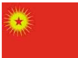
[Emblem des KADEK]

Um die Abkehr von den Zielen der PKK auch nach außen hin zu verdeutlichen, wurde die PKK im Jahre 2002 für aufgelöst erklärt. Als Nachfolgeorganisation gründete sich der „Friedens- und Demokratiekongress Kurdistans“ (KADEK). Erklärtes Ziel des KADEK war eine friedliche und demokratische Lösung der Kurdenfrage.